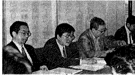
「仕事情報システム」

一昨年暮れの職安法改正で「供給・派遣」ができるようになった。事業主性については、労働組合が労働者を雇うことができるのが障害。三年後の見直し時に検討できるかを議論していきたい。