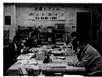
⑧ 派遣スタッフの労働条件実態調査の事業

新運転と自運労は、四月八日に「全国労供事業労働組合連合会(労供労連)」を結成し、自動車運送手分野での労供事業に力を入れています。